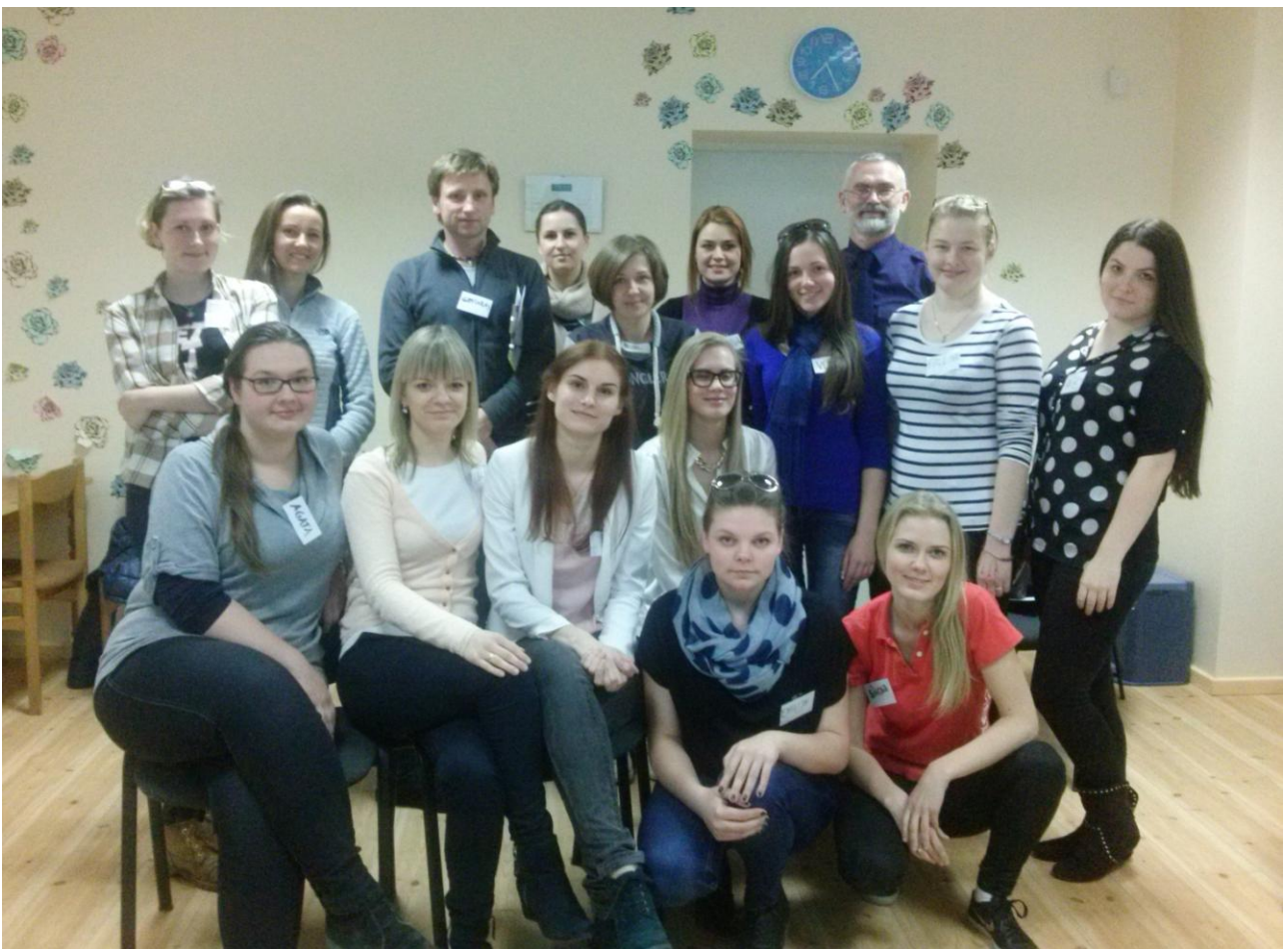
Kauno parengiamųjų kursų grupės