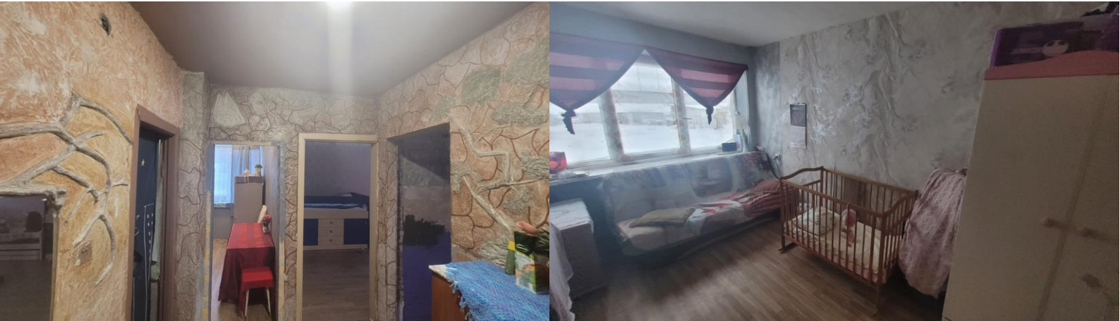
Ukmergės vaikų dienos centro patalpų remontas. Patalpos iki remonto: