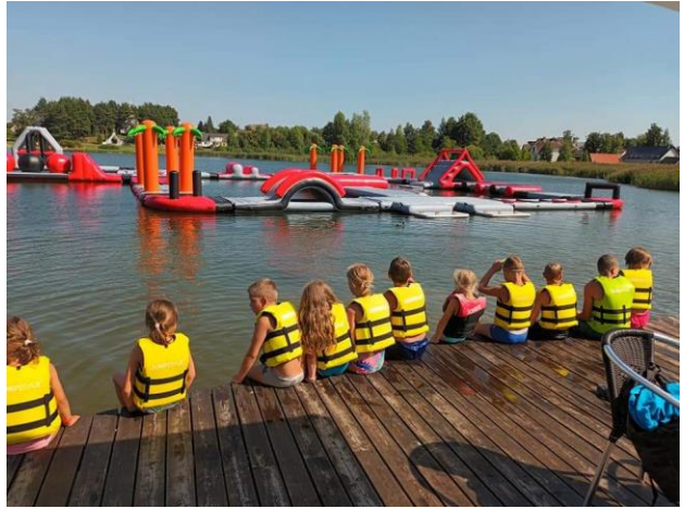
Išvyka į batutų parką