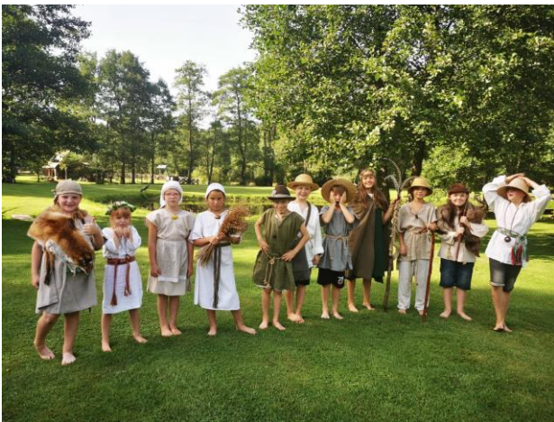
Senųjų amatų stovykla