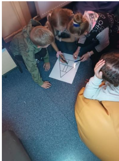
Sveikos mitybos edukacija