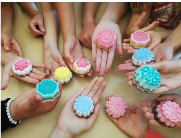
Muilo gamybos edukacija